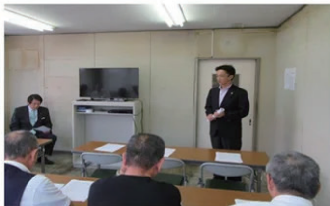
安全統括管理者による情報伝達