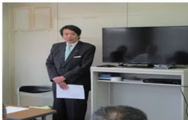
経営トップによる安全運行の方針